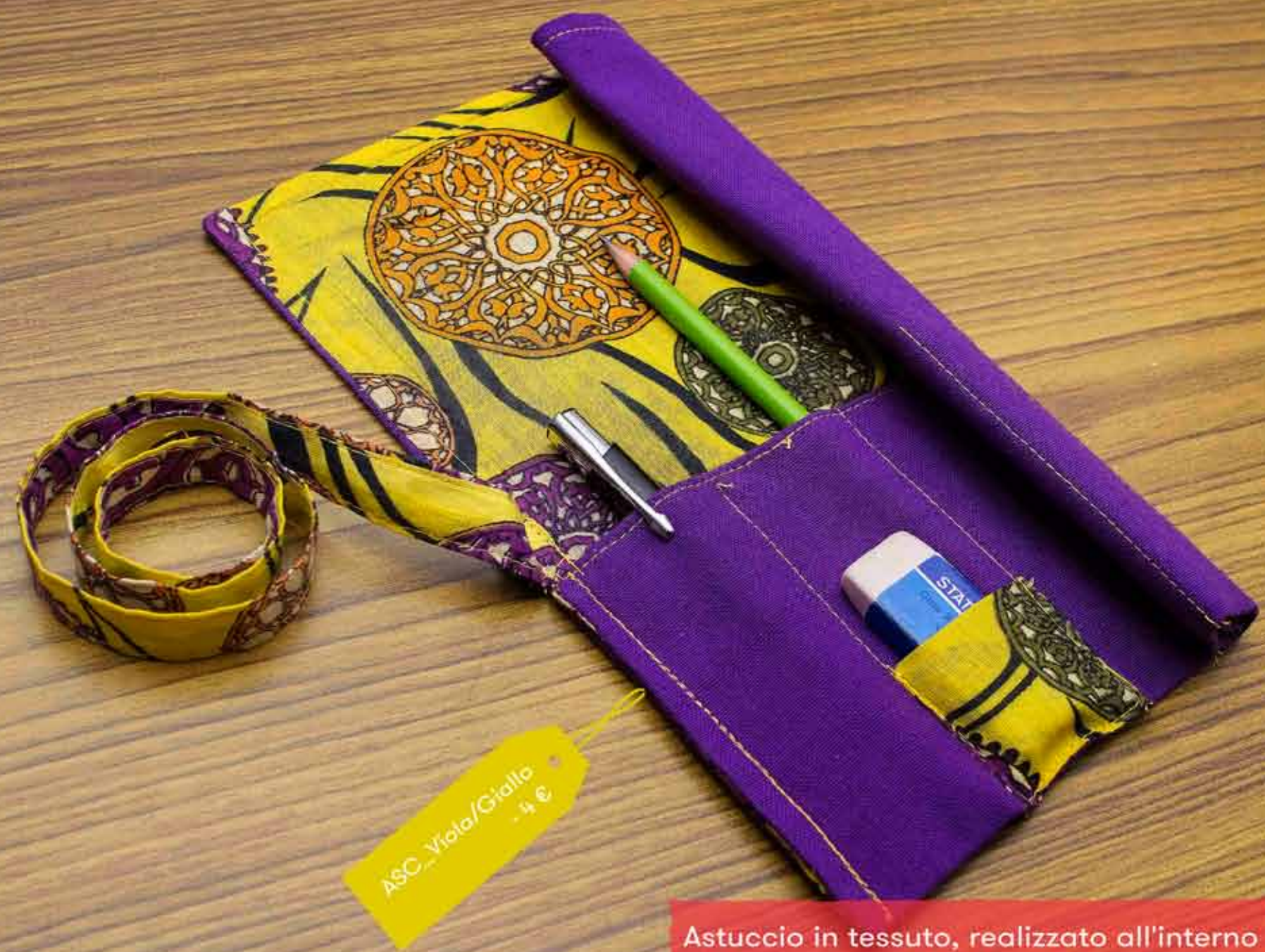
Astuccio in tessuto, realizzato all'interno del progetto CASANepal di Apeiron, con chiusura a laccio delle dimensioni di 25 x 25 cm circa.