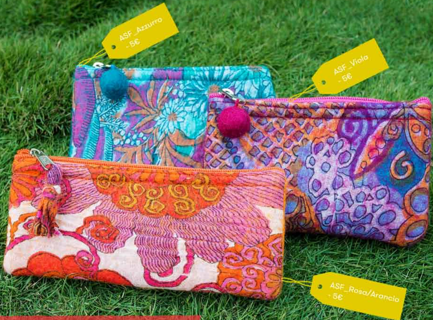
Astucci multiuso in feltro e tessuto con fantasie e colori vari delle dimensioni di 8 x 20 cm [astuccio rosa/arancio] o 11x17 cm [astucci azzurro e viola].